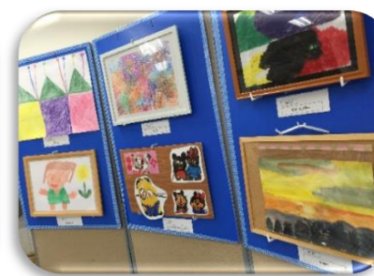
他にも、すばらしい作品がたくさんありました!