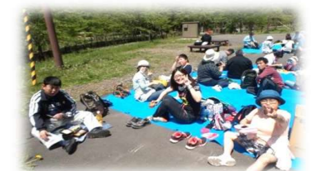
《春のレクリエーション》