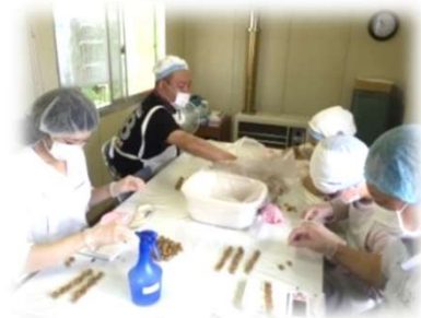
《珍味計量・袋詰め》