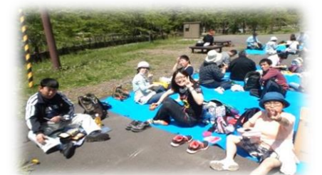
《春のレクリエーション》