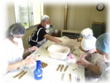
《珍味計量・袋詰め》