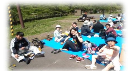
《春のレクリエーション》