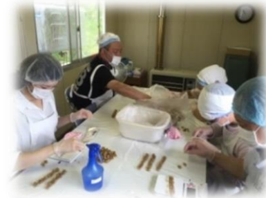
《珍味計量・袋詰め》