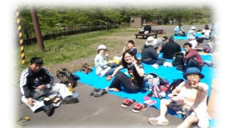
《春のレクリエーション》