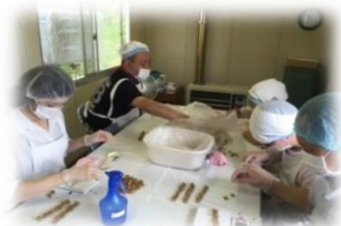
《珍味計量・袋詰め》